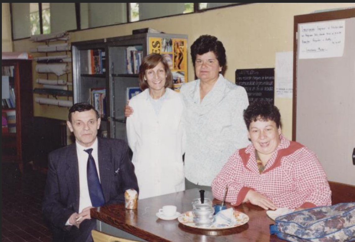
Junto a personal del IES, 2003