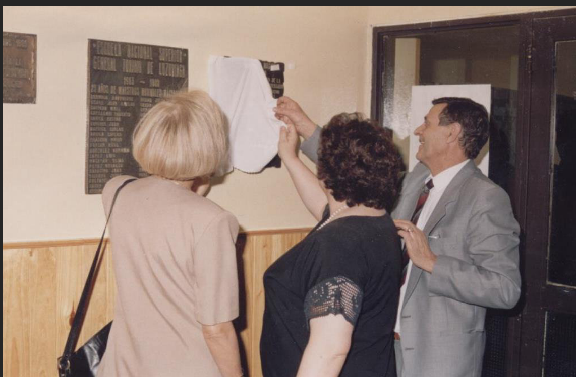
Descubrimiento placa recordatoria por el 30° Aniversario de la 1° Promoción, 1994