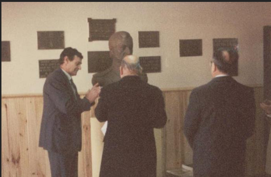
Inauguración del busto del Gral. Toribio de Luzuriaga, 6 de junio de 1991