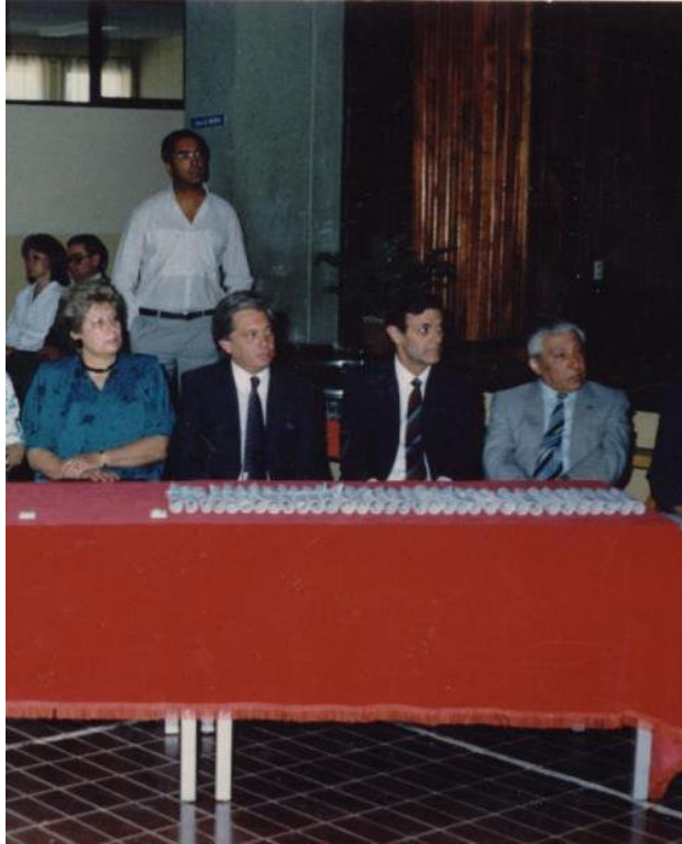
Acto de Colación 1984

Universidad Nacional de Cuyo para el dictado de la Licenciatura en Gestión Institucional y Curricular en el departamento de Tunuyán y con la Universidad Nacional de la Patagonia Austral a efecto de concretar proyectos de investigación, logrando además la vinculación con la Universidad Nacional de San Luis para delinear acciones futuras.