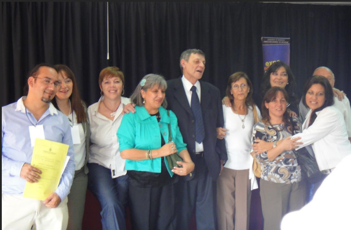
Durante la Expo educativa 2011, recibió el reconocimiento Domingo Faustino Sarmiento a la trayectoria en la formación docente.