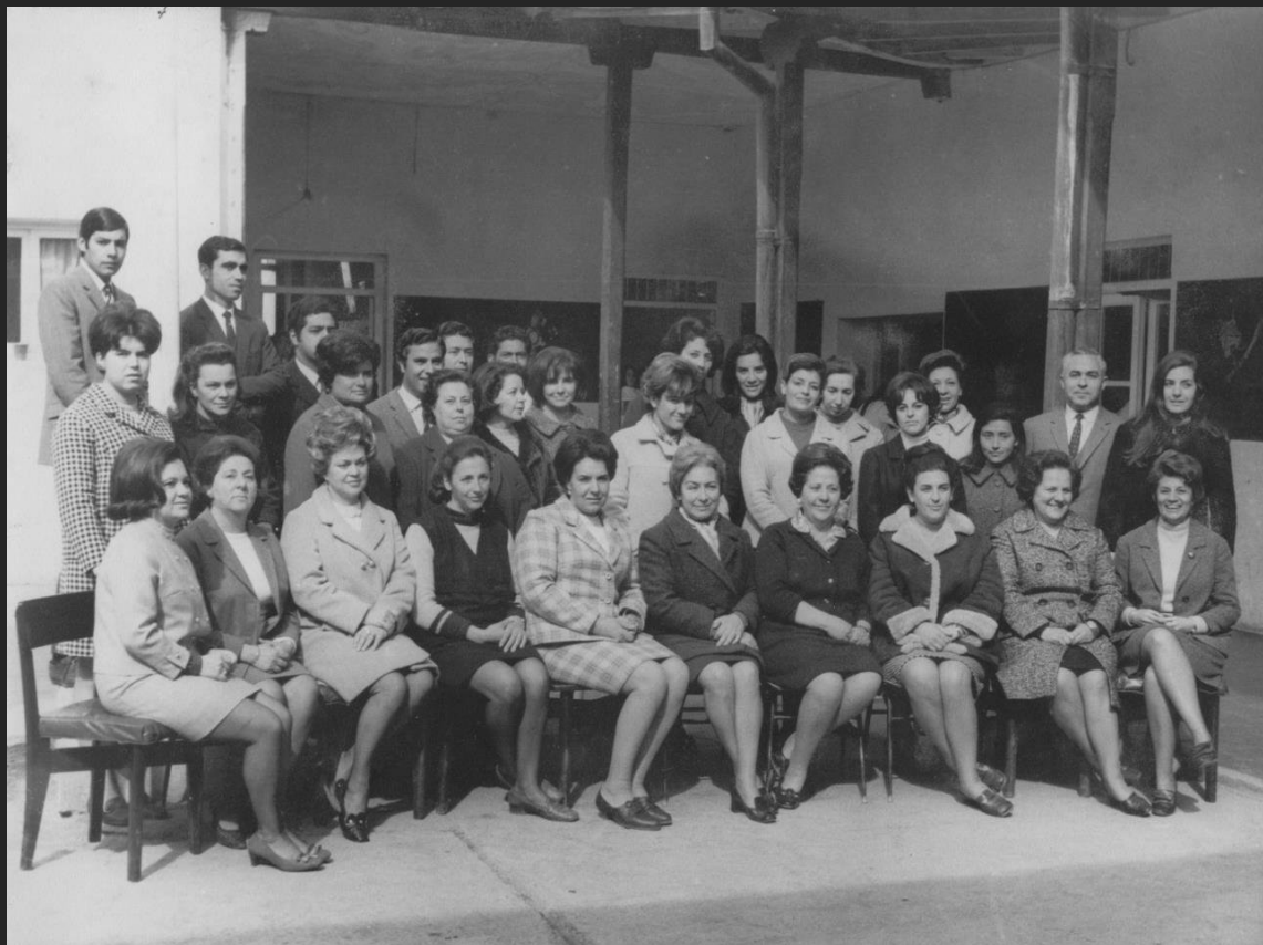
Como Profesor de Educación Física junto al Personal Directivo, administrativo y docente, 1968