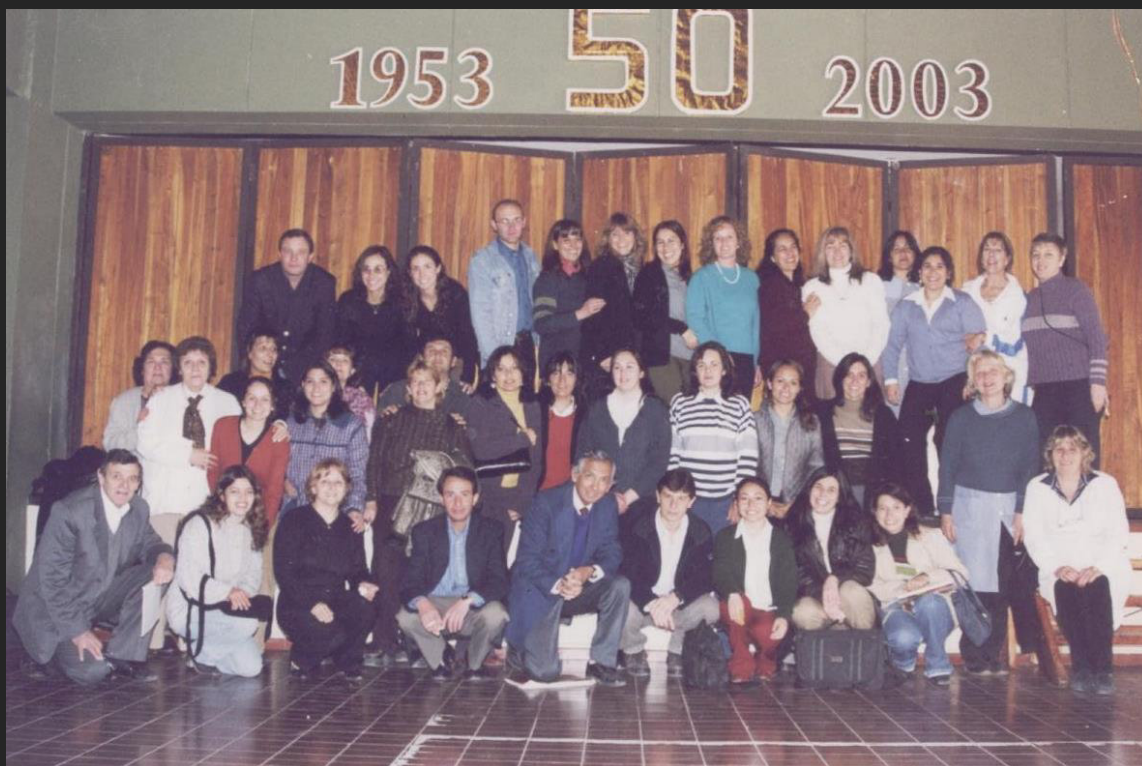
Como Director del establecimiento junto al personal directivo, administrativo y docente en el 50º Aniversario de la Escuela Normal, 2003