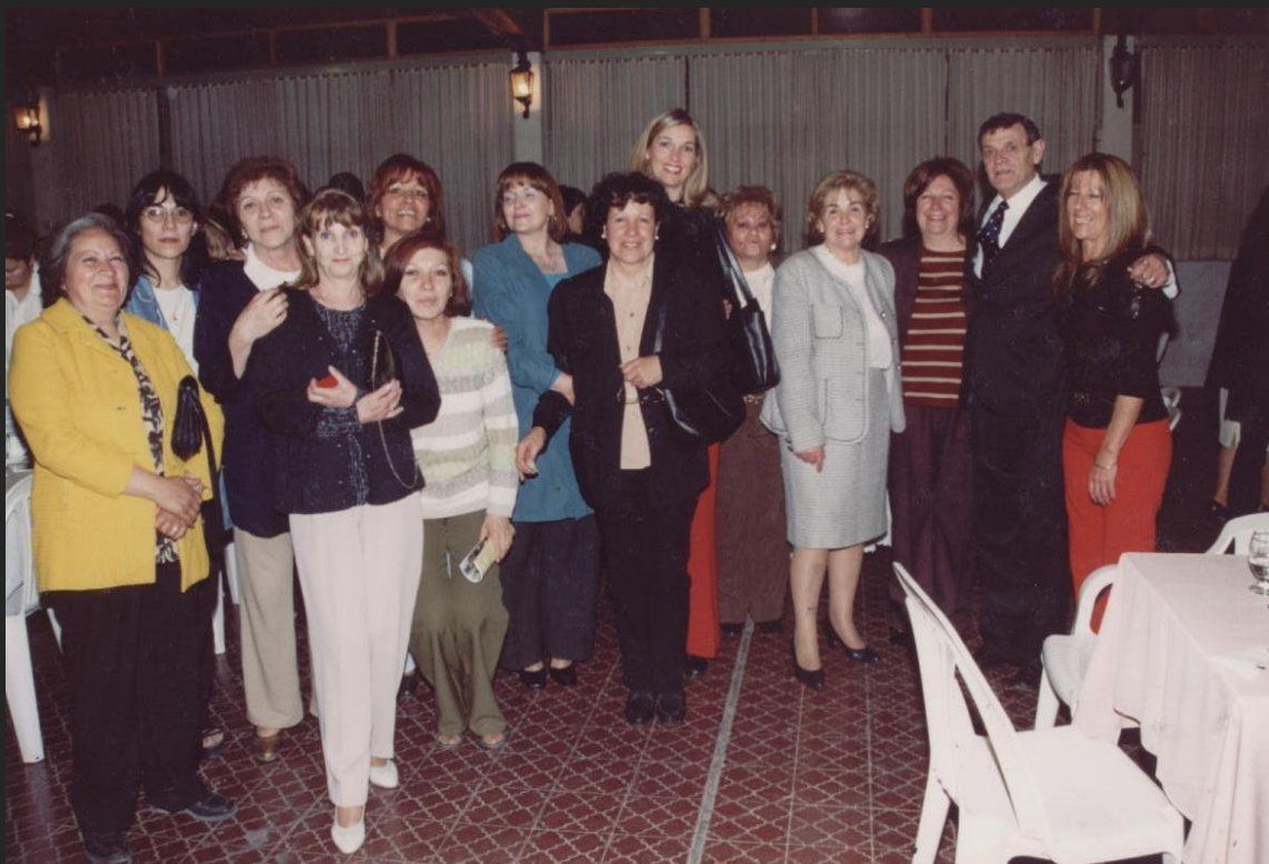
Agasajo de parte del Municipio de Tunuyán en el Día del Maestro. Se le entregó el Premio a la Trayectoria, 2003